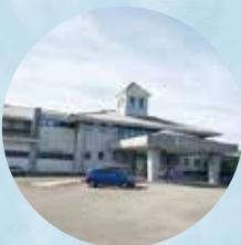
ゴール地点は、 不知火海を一望できる 御立岬温泉センター

※上田浦駅には駐車場はありません。 車でお越しの方は御立岬公園駅駐車場 をご利用ください。